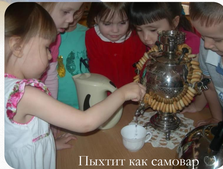
Пыхтит как самовар