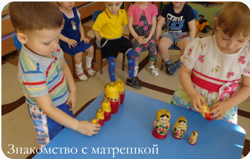
Знакомство с матрешкой