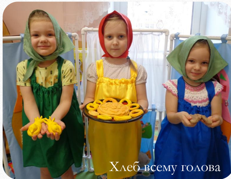
Хлеб всему голова