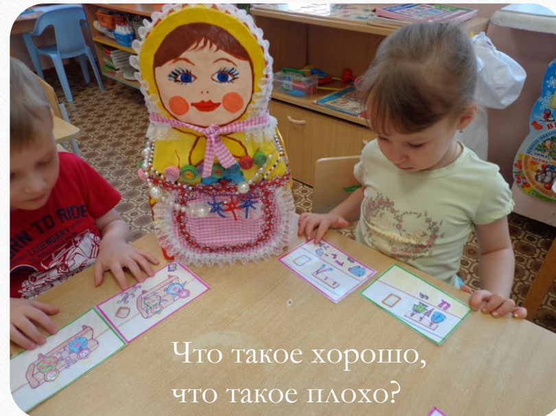
Что такое хорошо, что такое плохо?